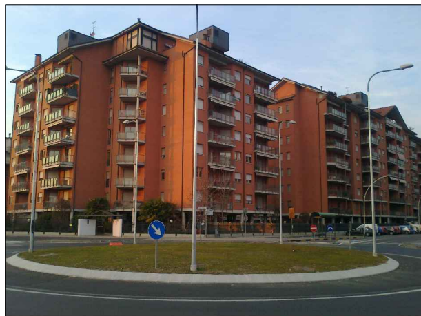
Via Rieti angolo Strada della Pronda